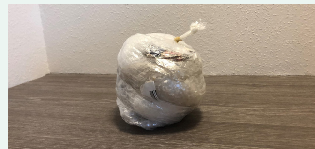
Så fylder det ikke særligt meget.