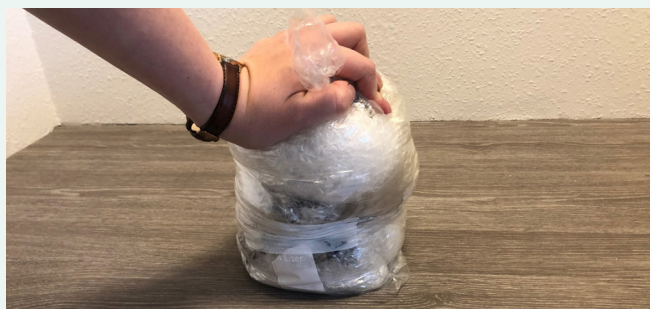
Læg det i en pose og tryk luften ud.