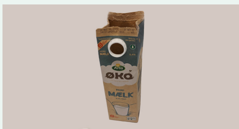
Åbn kartonen foroven

Du kan folde mælkekartoner og juicekartoner fladt sammen.