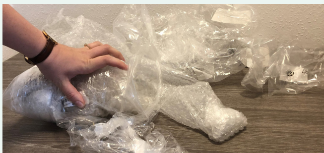
Plastfolie kan fylde meget, når det er løst.