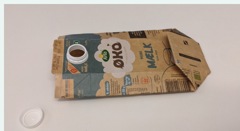
Fold toppen ned og sæt den fast