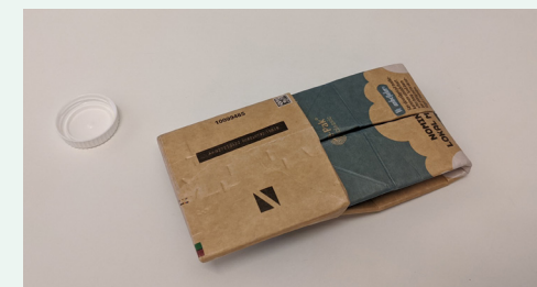
Pres siderne ud og fold bunden