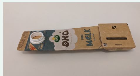
Buk siderne ind